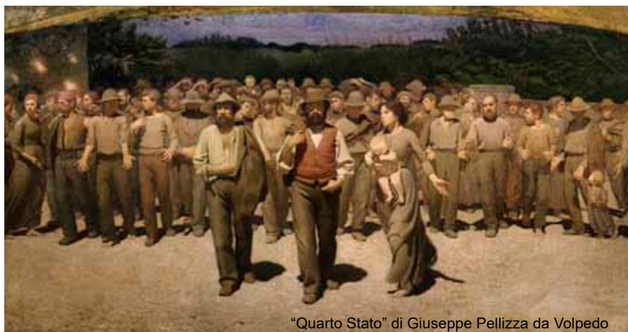
"Quarto Stato" di Giuseppe Pellizza da Volpedo